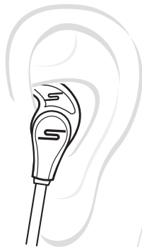
Posizionamento Stay Fit

Far riferimento a questa guida per una descrizione e la posizione dei tasti e altre funzioni menzionate nel manuale.